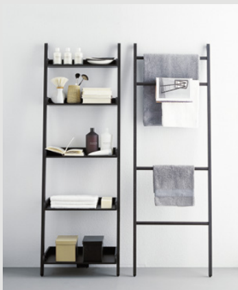
design Benedini Associati

Los complementos Stairs se apoyan simplemente contra la pared, sin taladros de fijación. Disponibles en roble natural, marrón, oscuro o barnizado color teca, o también lacados en blanco o gris. La versatilidad y la facilidad de colocación de los complementos Stairs permiten crear distintas composiciones: para decorar un rincón inutilizado o para personalizar un espacio en general.